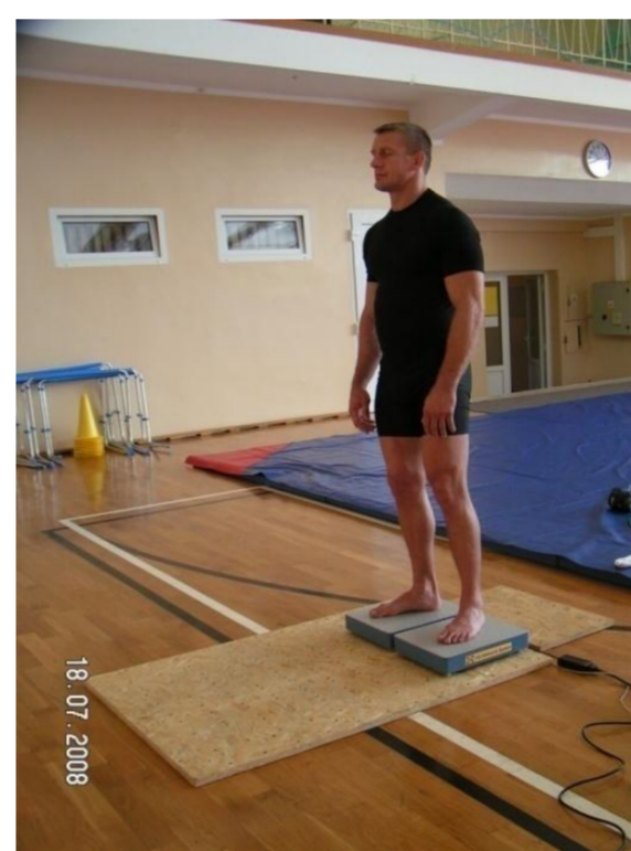
Ryszard Wolny Mistrz Olimpijski z Atlanty 5 krotny olimpijczyk 9 medali Mistrzostw Świata i Europy, 10-krotny Mistrz Polski