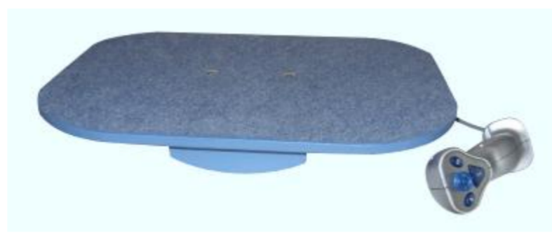
Balansowa Platforma Treningowa

Zaproponowany sposób treningu równowagi, koordynacji, umożliwia likwidowanie różnic w sposobie obciążania kończyn dolnych i jest istotną przesłanką dla trafności oceny zjawisk: równowagi, stabilności oraz symetrii obciążania kończyn dolnych badanych osób. Możliwość dowolnego ustawienia kąta zadziaływania platformy znacząco zwiększa możliwości ukierunkowanych ćwiczeń korekcyjnych.