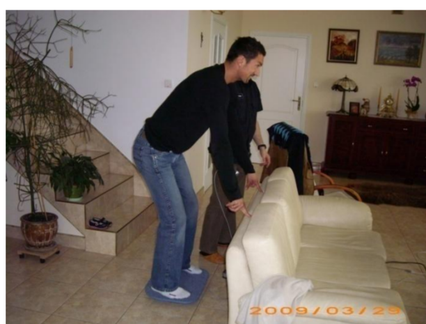
Dariusz Dudek Piłka nożna

4 krotny olimpijczyk 3 krotny Mistrz Europy 8 medali Mistrzostw Świata i Europy wielokrotny mistrz Polski obecnie Trener Kadry Narodowej w zapasy styl wolny